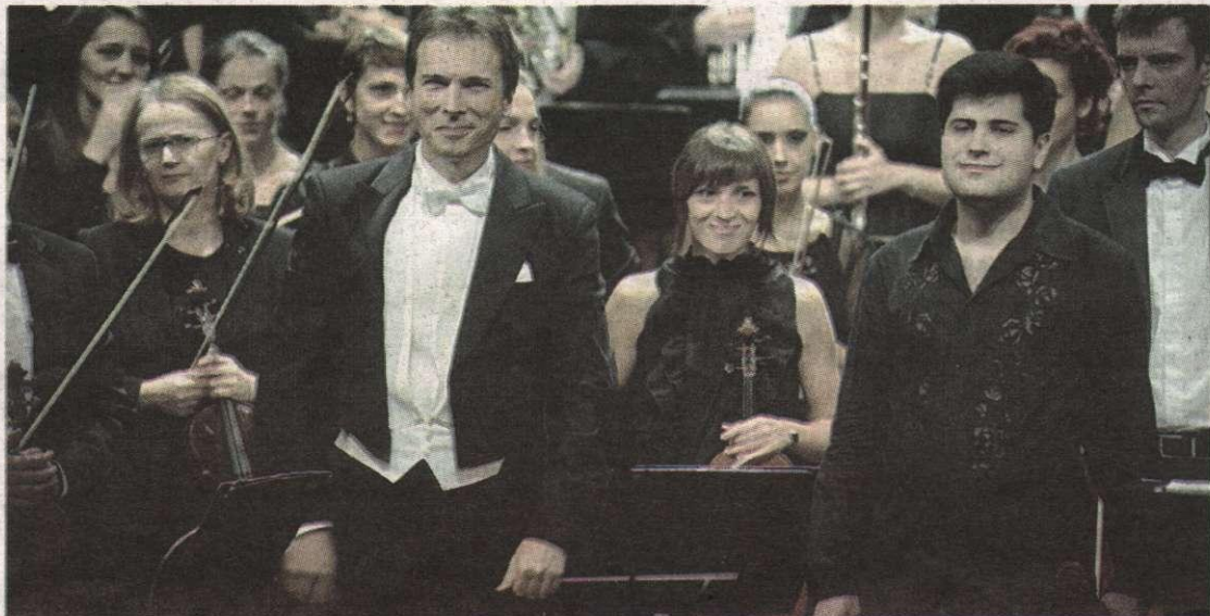
Sigurnost i ljepota: Sa sinoćnjeg koncerta u CNP-u