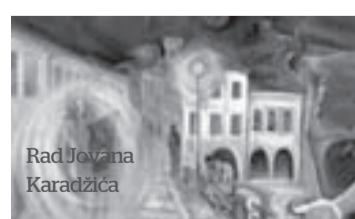
Rad Jovana Karadžića