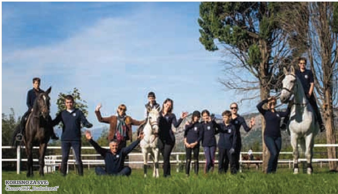
KORISNO ZA SVE: Članovi KKK „Budućnost“

Nova sezona škole jahanja u klubu „Budućnost“ zvanično je otvorena, a počelo je i prijavljivanje zainteresovanih za školu jahanja u sezoni 2016/17.