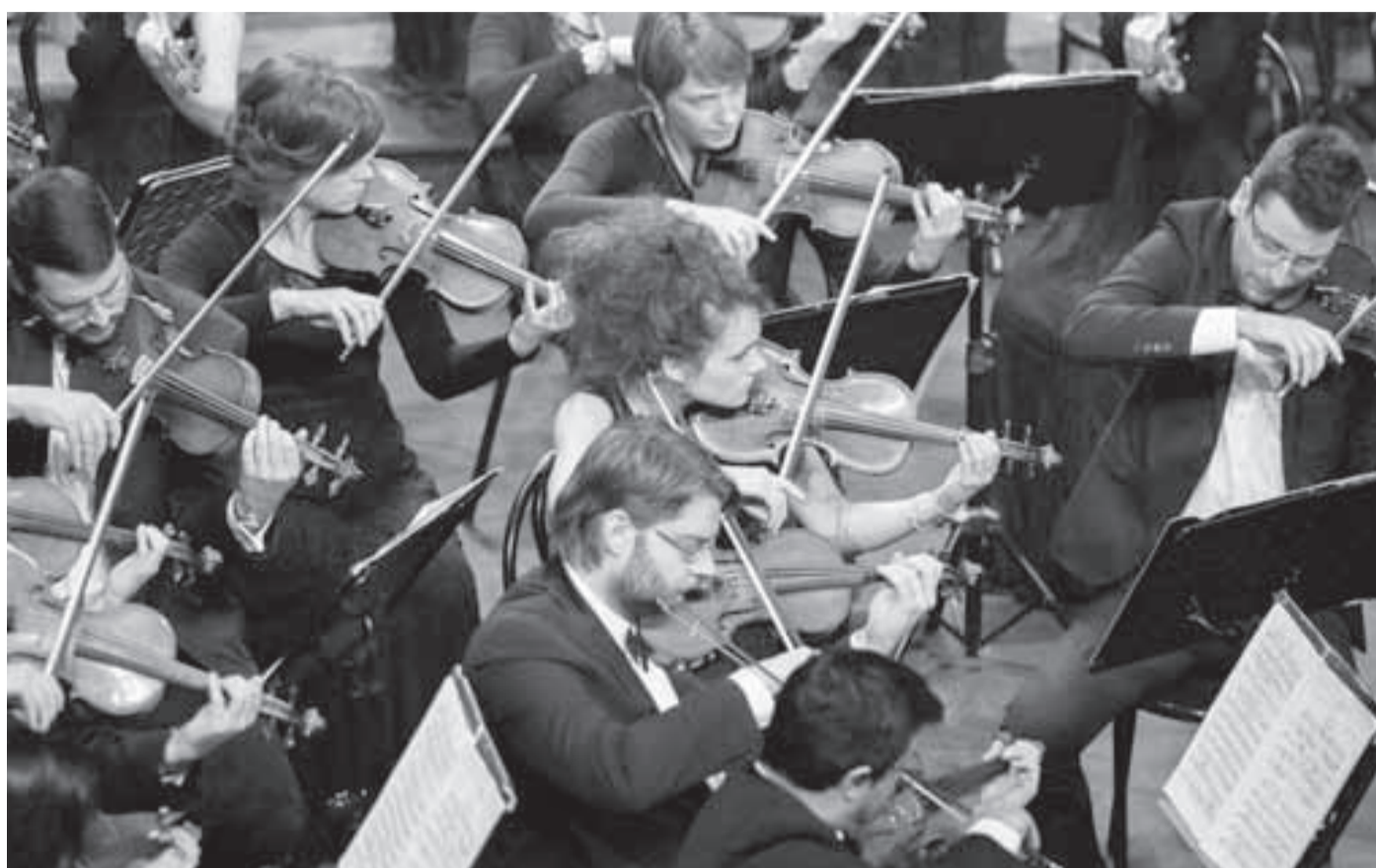
SIGURNO I UBJEDLJIVO: Koncert crnogorskih simfoničara u CNP-u

Nakon neuspjeha drame „Arlezijanaka“ francuskog književnika Alfonsa Dodea iz 1872. go-