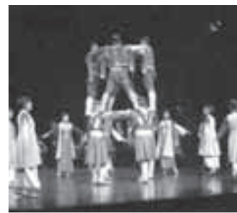
NEMATERIJALNA BAŠTINA: Crnogorski oro