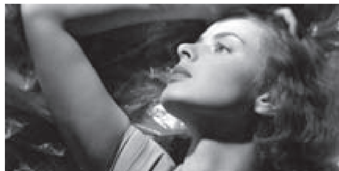
„Ingrid Bergman - Njenim riječima“

PODGORICA - U okviru 8. UnderhillFesta večeras u 18 sati, projekcijom filma „Ingrid Bergman - Njenim riječima“, u Narodnoj biblioteci, „Radosav Ljumović“ počinje program „U fokusu“, koji festival organizuje u saradnji sa Centrom za ženska prava. Film je dio međunarodne selekcije ovogodišnjeg UnderhillFesta. Nakon projekcije, u 20 sati bi-