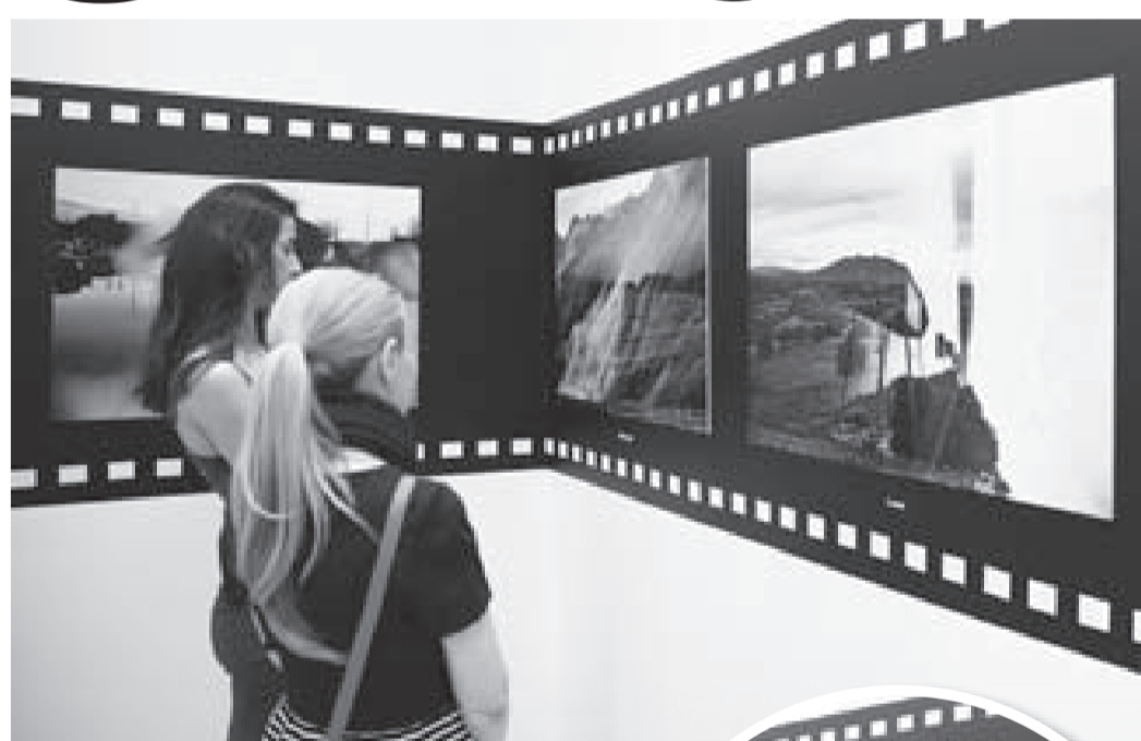
PRIZORSKI SNOVI DENJIMA: Sa otvaranja izložbe u Podgorici