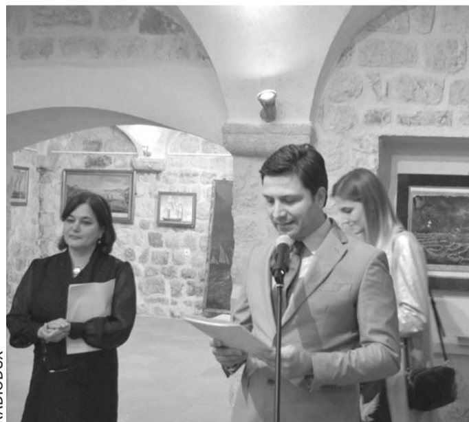
Sa otvaranja izložbe u Galeriji solidarnosti

-U dugom periodu minulih vijekova kroz koji su se prožimali uticaji ova dva naroda, uvijek smo znali prepoznati i prihvatiti kulturne vrijednosti, a njegujući ih i čuvajući, postajali su nam savršeni uzor za sopstveno uzdizanje svijesti o bogatstvu