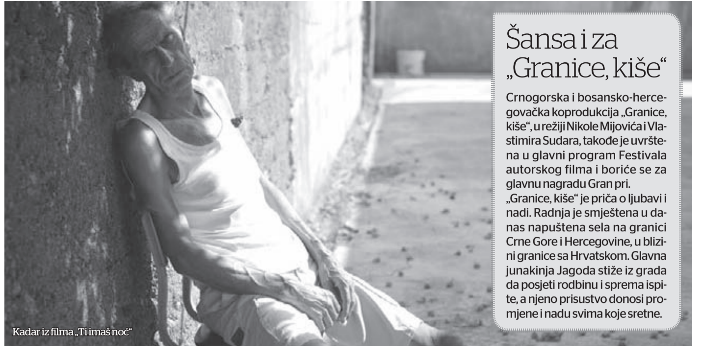
Kadar iz filma „Ti imaš noć“