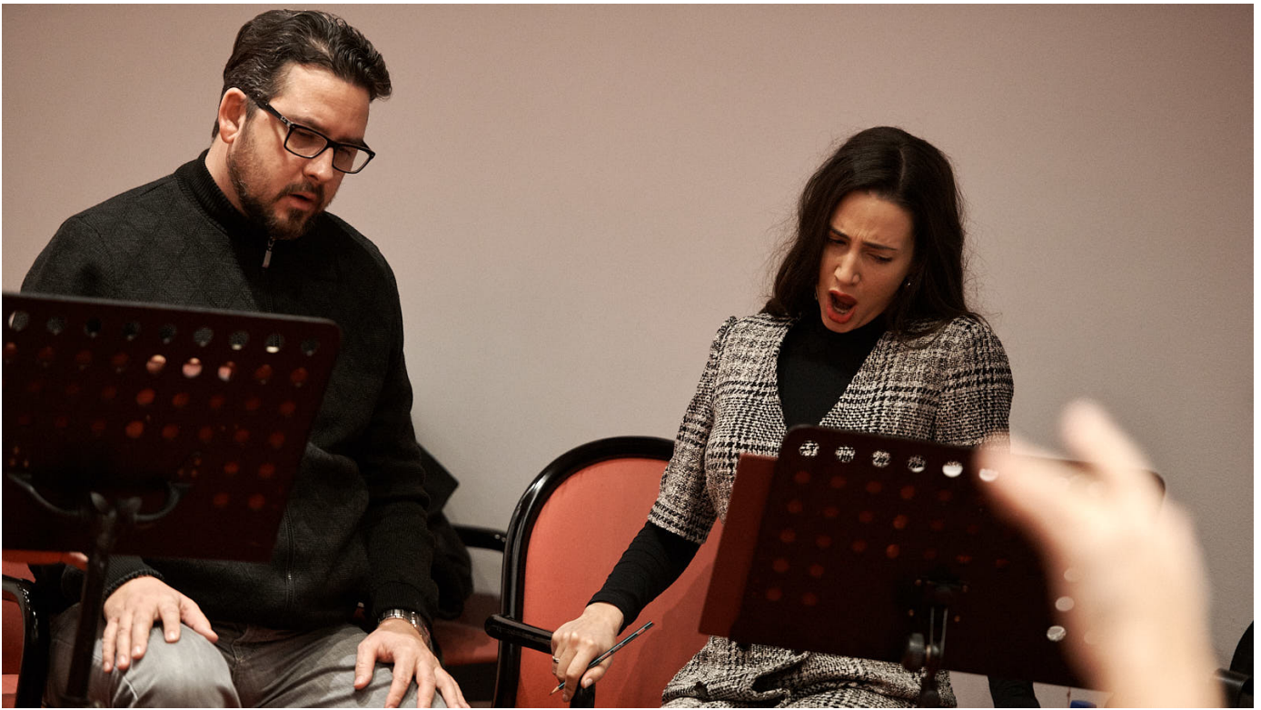
Sa proba u CNP-u