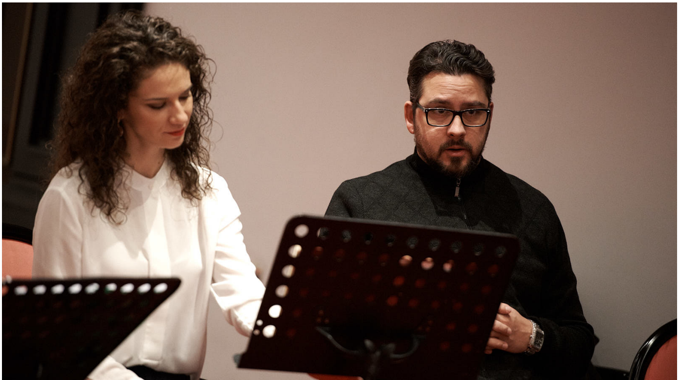
Sa proba u CNP-u

Prije svega, “Boem” je moja omiljena operaska predstava. Ono što je uvijek izazov kada su “Boemi” u pitanju, to je razigranost koju, biću slobodan da kaŹem, moŹda ne krase nijedna druga opera. Ovo je opersko djelo u kome gluma i igra imaju podjednaki znaĉaj, kao i pjevanje, što za svakog operskog umjetnika predstavlja ogroman i prekrasan izazov.